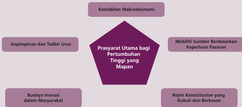
Rajah 1 Lima Teras untuk Perkembangan Ekonomi yang Mampan

Walaupun maklumat yang banyak mengenai pembangunan tidak memberikan satu formula pembangunan ekonomi yang jelas, akan tetapi pengalaman dapat memberikan contoh faktor yang perlu dijawab (Rajah 2). Yang penting ialah faktor di sebalik penentuan harga pasaran yang digunakan untuk mengekalkan daya saing kos yang tidak mencerminkan kedudukan sebenar. Dalam kebanyakan ekonomi membangun, faktor tersebut wujud dalam berbagai-bagai bentuk, daripada kawalan harga dan subsidi tenaga, hinggalah kepada perlindungan terbuka kepada sektor dan industri tertentu. Walaupun